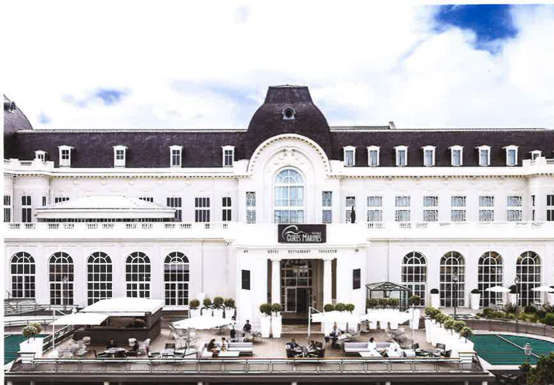
© Façade - Les cures marines de Trouville

L'ÉTÉ SE TERMINE ET LE SOLEIL EST MOINS PRÉSENT... NOUS AVONS TOUS ENVIE D'AFFICHER UNE MINE ENSOLEILLÉE AVEC UNE PEAU DU VISAGE FERME, DÉTENDUE ET FRAÎCHE, MAIS AUSSI DE PRENDRE SOIN DE SOI, DE FAIRE DU SPORT ET SE RESSOURCER. VOICI NOS CONSEILS POUR ATTAQUER LA RENTRÉE EN GRANDE FORME.