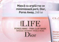
Mască cu argilă roz ce minimizează porii, Dior, Pores Away, 248 lei

Mască bio pentru luminizitate, Bema, Lightening Mask, 145 lei