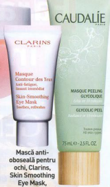
Mască anti-oboșeală pentru ochi, Clarins, Skin Smoothing Eye Mask, 155 lei