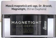
Mască magnetică anti-age, Dr. Brandt, Magnetight, 353 lei (Sephora)