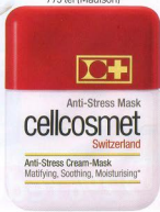
Mască anti-stres, Cellcosmet, 795 lei (Madison)