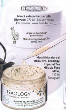
Mască hidratare și strălucire, Teaology, Imperial Tea Miracle Face Mask, 163 lei (Douglas)

Mască exfoliantă cu argilă, Diptyque, 273 lei (Beautik Haute Parfumerie, www.beautik.ro)