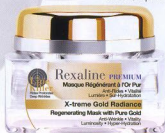
Mască regenerantă cu aur, Rexaline, X-treme Gold Radiance, 315 lei (Sephora)