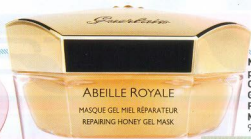
Mască peeling, Caudalie, Glycolic Peeling Mask, 93 lei

Argile de Gommage pour le Visage Multi-Use Exfoliating Clay for the Face